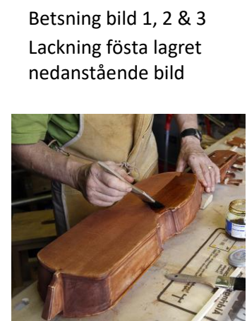
Betsning bild 1, 2 & 3 Lackning första lagret nedanstående bild