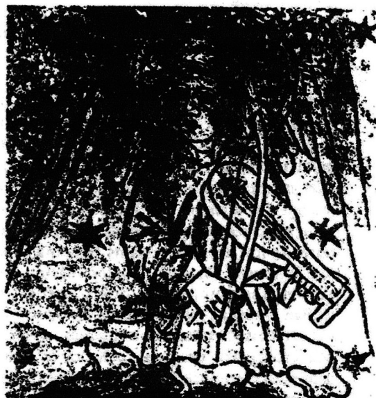
Ängel med nyckelharpa, kalkmålning från Sönga kyrka i Uppland. Daterad till 1468. Ur Jan Lings bok "Nyckelharpan".