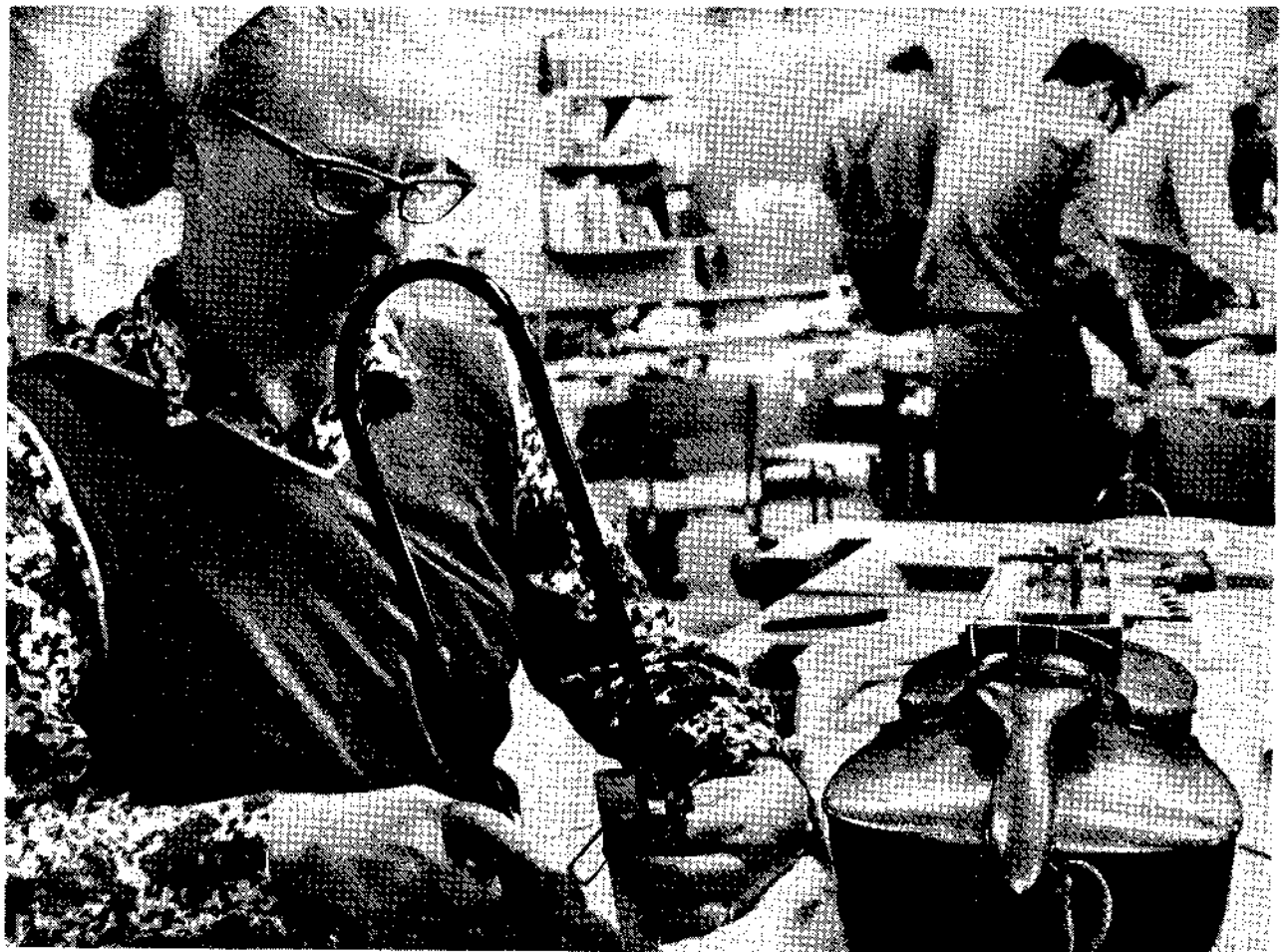
Tillverkning av knaver.

Jag m ste f rst som sist erk nna, och h r  r jag nog inte ensam, att jag hittills f rh llit mig lite skeptisk till den digra vetenskapliga dokumentationen i  mnet som till st rsta delen  gnar sig  t att spekulera i hur de gamla m starna egentligen gjorde. Finns det verkligen n got utrymme f r det egna skapandet eller handlar det bara om att f rs ka kopiera? Jag har inte heller riktigt velat acceptera de h r moderna metoderna att st mma av fiolens olika delar med hj lp av diverse teknisk apparatur f r att inte n mna datorber kning av stall, basbj lke etc. Jag skall g rna kommentera det h r mer ing ende vid ett annat tillf lle.