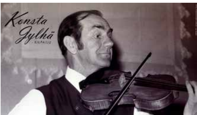
Konsta Jylhä, från ett stort foto som hängde på väggen vid ett instrumentseminarium i Kaustinen 2011

Vi är många som är helt överens med mig om att Nyckelharpan aldrig skulle fått den renessans som den har fått om vi inte haft vår Eric Sahlström (1912-1986). Alla i Sverige kanske inte känner till att Kaustinen kanske aldrig skulle fått sin folkmusikrenessans om de inte haft sin storspelman Konsta Jylhä (1910-1984) som alltså, så när som på två år, levde helt samtida med Eric Sahlström.