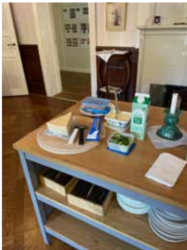
Smörgåsbordet inför starten

Efter kursen fick han en harpa till låns av ESI, Magnus Holmström, och den övas det nu flitigt på.