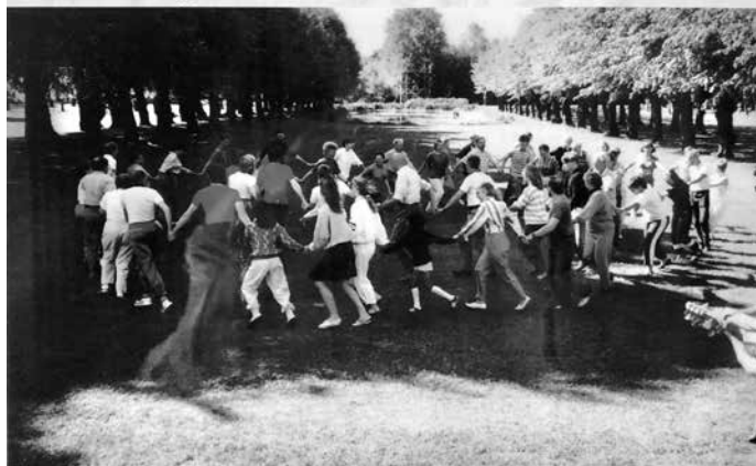
Danslektion i parken

Dessutom hade deltagarna med sig materialet hem på sina kassetband. Undervisningen omfattade främst traditionell norduppländsk folkmusik avsedd att dansa och gå till.