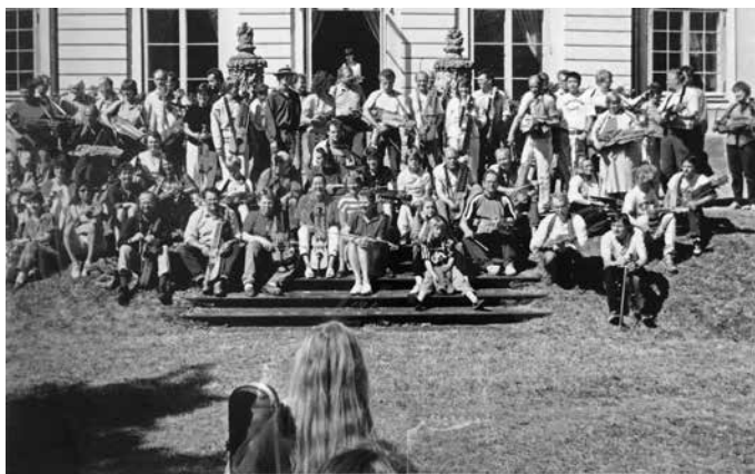
Kursen 1990.

utan på så vis blev Österbykurserna ett utbildningsinstitut för folkmusiklärare. Jag tillfrågade spelmän som kunde spela bra, men som framför allt var bra pedagoger och medmänniskor.