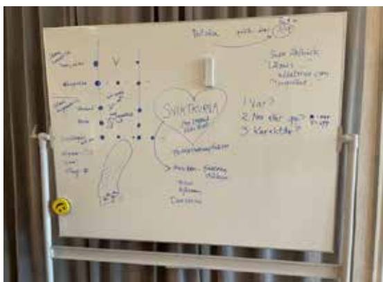
Teori med sviktkurva, riff mm.